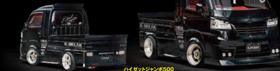
ハイゼットジャンボ500 フロントバンパー/サイドステップ/リアバンパー/専用オーバーフェンダー/ワイバーガード/ルーフウイング/リアウイング/アイライン装着