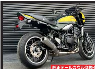
純正テールカウル交換タイプ