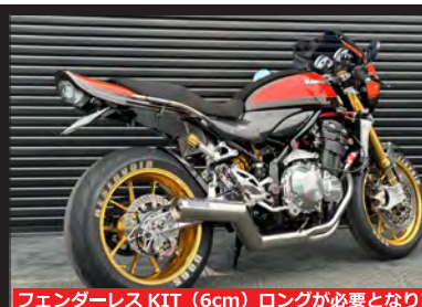
フェンダーレス KIT (6cm) ロングが必要となります。

ダックテール (ショート) ¥ 38,500 (税込) ¥ 35,000 (税別)