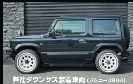
弊社ダウンサス装着車両 (ジムニー-JB64)