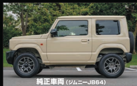
純正車両 (ジムニー-JB64)

●ジムニー(JB64)ジムニーシエラ(JB74)用 50mmダウンサス ¥29,000(税抜) ¥31,900(税込)