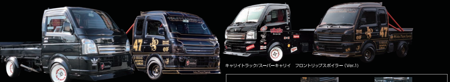
キャリイトラック/スーパーキャリイ フロントリップスポイラー(Ver.2)