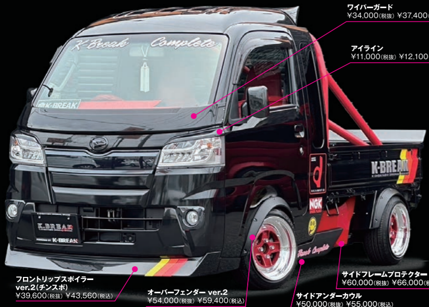
フロントリップスポイラー ver.2(チンスポ) ¥39,600(税抜) ¥43,560(税込)