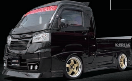
ハイゼットジャンボ500