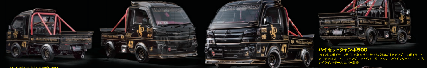
ハイゼットジャンボ500