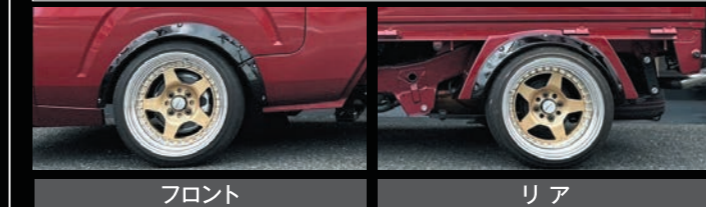
純正アーチから50mmDOWN 純正フェンダーから50mmWIDE