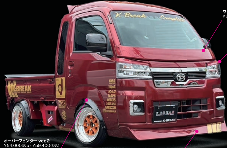
オーバーフェンダー ver.2 ¥54,000(税抜) ¥59,400(税込)