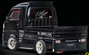
ハイゼットジャンボ500